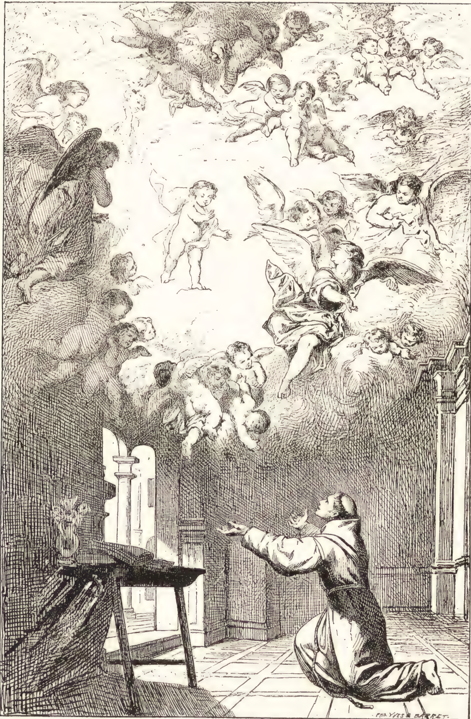
SANT ANTOINE DE PADOUE. (Cathédrale de Séville.)